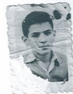
Foto de ingreso